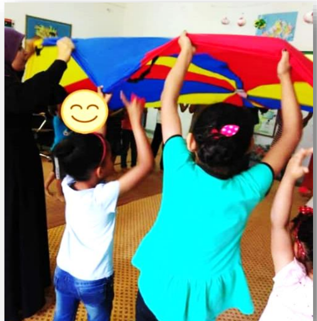
بعض صور برنامج الدعم النفسي والاجتماعي للأسر النازحة