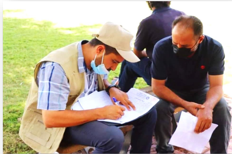
صور لبعض الباحثين أثناء العمل الميداني